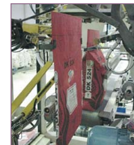
CSA 100 Colocación y estirado del saco Bag placing and stretching