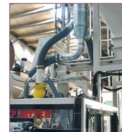
CSA 75 Sistema de aspiración de polvo De-dusting system