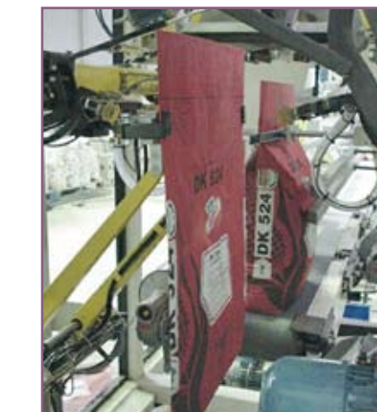
CSA 100 Colocación y estirado del saco Bag placing and stretching