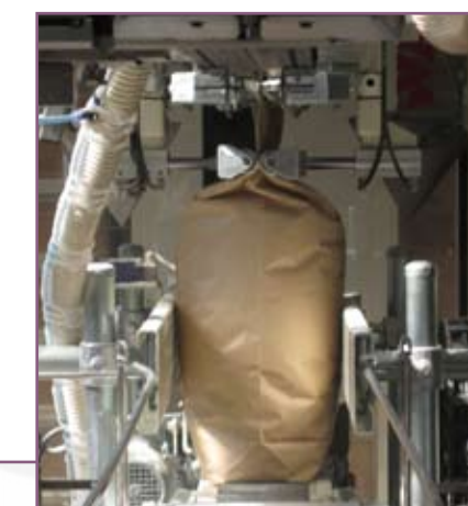
CSA 75 Extracción aire residual Extraction of residual air