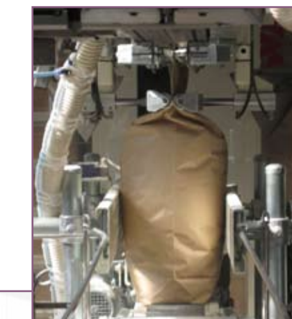
CSA 75 Extracción aire residual Extraction of residual air