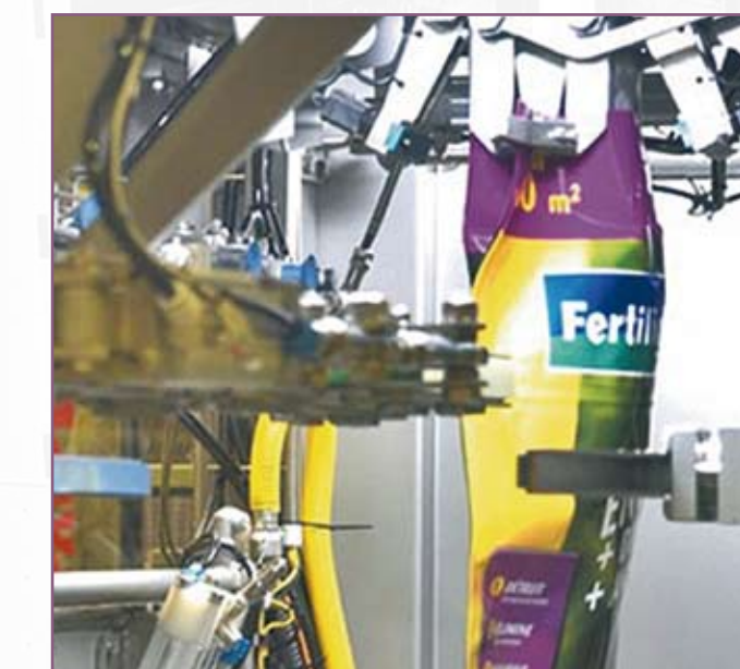
CSA 105 Manipulación de sacos con fuelles laterales Handling of side-gusseted sacks