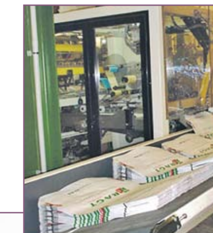
CSA 100 Almacén de sacos vacíos de gran autonomía Large autonomy empty sacks tray