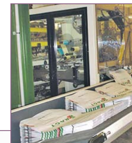
CSA 100 Almacén de sacos vacíos de gran autonomía Large autonomy empty sacks tray