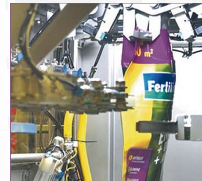
CSA 105 Manipulación de sacos con fuelles laterales Handling of side-gusseted sacks