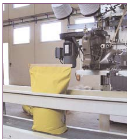
CSA 95 Acabado final del saco lleno Final looking of filled bag