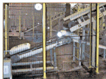
Rehuse automático de los sacos en la cinta de transporte Automatic rejecting system of the bag in the belt conveyor